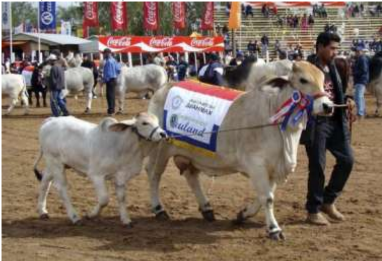
La Gran Campeona de la raza Brahman, hembras. Expositor: Cabaña Kröker, en el desfile de presentación en la Expo Neuland.